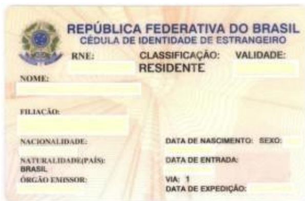
Carte d'identité d'étranger - CIE.

Après la remise des documents, la Police fédérale fournira à l'étudiant un protocole jusqu'à la délivrance de la carte d'identité de l'étranger (CIE), ce qui peut prendre un certain temps.