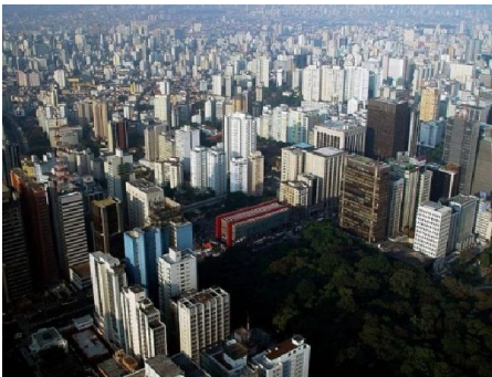
São Paulo, capitale de São Paulo.

Elle comprend les États d'Espírito Santo (ES), Rio de Janeiro (RJ), Minas Gerais (MG) et São Paulo (SP).