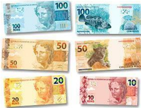
De vrais certificats.