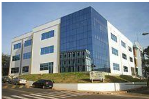
Université d'État de Campinas - Unicamp.

licence est le titre désigné à la Professionnel de différents domaines de connaissances qui travailleront dans différents domaines de travail et d'activités, En tant que pratique professionnelle