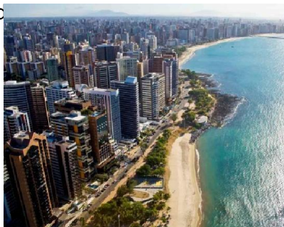
Fortaleza, capitale du Ceará.

villes : Salvador – BA Fortaleza – CE Recife – PE