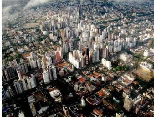
Curitiba, capitale du Paraná.

Le climat subtropical, avec les températures les plus basses du pays, prédomine dans la région. En plus des vestiges de la forêt d'Araucaria, le sud est couvert de végétation favorable à l'élevage, l'une de ses principales activités économiques.