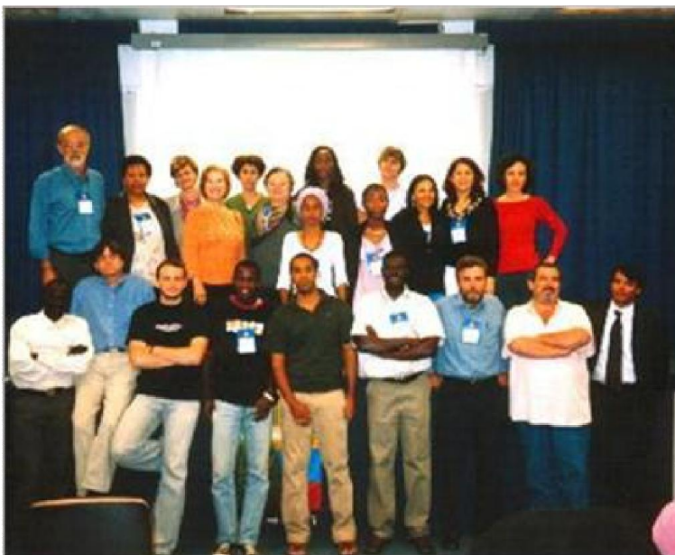
Accord étudiant-et responsables du PEC-G lors d'une réunion régionale pour évaluer le programme, à Florianópolis-SC, 2005.

Créé en 1964, le Programme d'Accord Étudiant de Premier Cycle (PEC-G) offre des postes vacants de premier cycle dans les établissements d'enseignement supérieur brésiliens (HE Institutions) aux étudiants des pays en développement avec lesquels le Brésil a un accord de coopération éducative, culturelle ou scientifique-technologique.