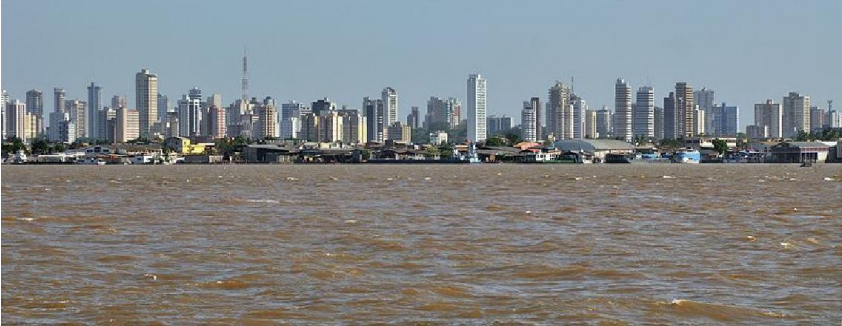
Belém, capitale du Pará.