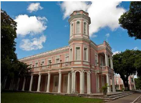
Université fédérale du Ceará - UFC.

Les établissements d'enseignement supérieur peuvent être publics ou privés. Les institutions publiques sont créées et maintenues par le gouvernement dans les trois sphères – fédérale, étatique et municipale. Les institutions privées sont créées et maintenues par des entités juridiques privées, avec ou sans profit.