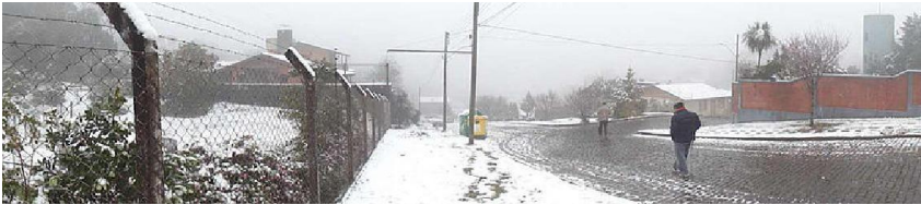
Hiver 2013 à Caxias do Sul, Rio Grande do Sul - RS.