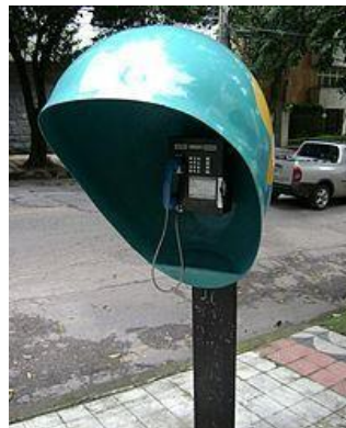
Téléphone public, ou cabine

Des téléphones publics, communément appelés « orelhões », se trouvent dans les terminaux de transport, les coins, les places ou les centres commerciaux. Pour passer un appel, vous devez acheter une carte téléphonique.