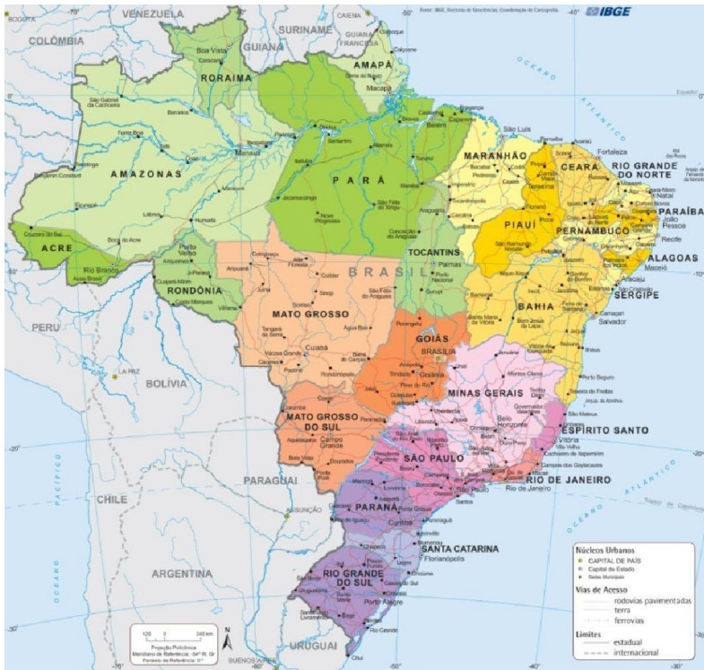
Carte politique du Brésil.

Nom officiel : République fédérative du Brésil