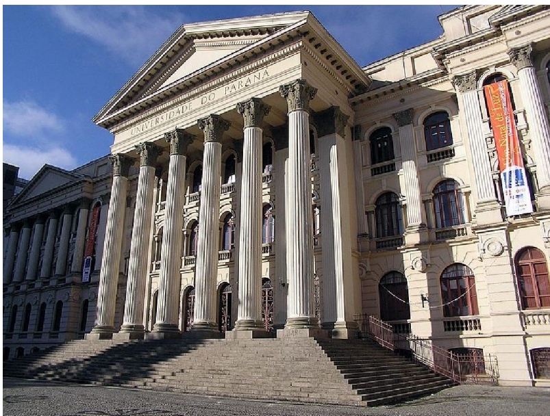
Université fédérale du Paraná - UFPR, l'une des plus anciennes du Brésil.

L'enseignement supérieur brésilien est essentiellement régi par les lois 9.394/96, 9.131/95, 9.192/95, par les avis et résolutions