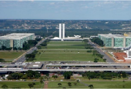
Brasilia, capitale du Brésil.

Dans les années 60, la colonisation du Midwest a été accélérée par le transfert de la capitale fédérale à Brasília. La population s'est formée avec des migrants venant de toutes les autres régions du pays. La population urbaine est relativement importante.