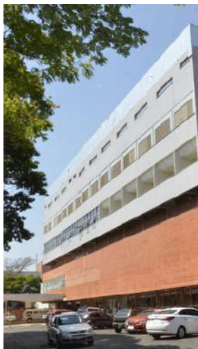
Hospital de las Clínicas - UFU

El estudiante debe presentar, obligatoriamente, un seguro de salud antes del inicio de la movilidad.