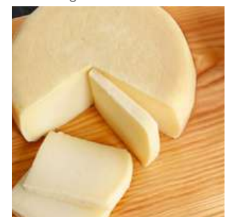
Queso típico de Minas Gerais