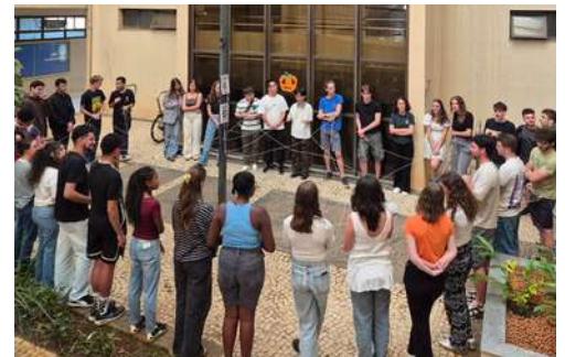
Recepciones de estudiantes internacionales 2025

¿Ha oído hablar del Programa de Mentoría para la Integración Global de la Universidad Federal de Uberlândia? El MIGUFU es un programa en el que estudiantes de la UFU ayudan a estudiantes de otros países que están comenzando sus estudios en la Universidad. ¿Le gustaría contar con un(a) mentor(a) MIGUFU para que le ayude?