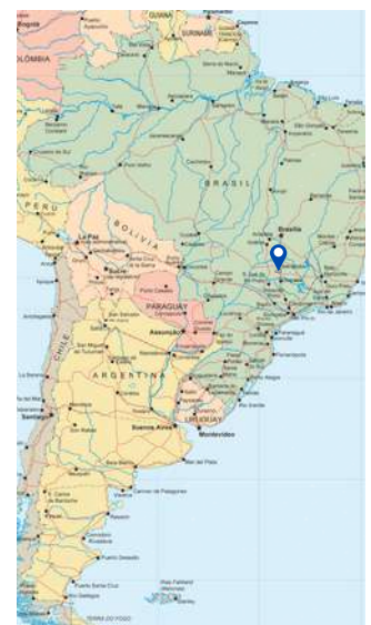
Ubicación de Uberlândia

Recomendamos que traigas ropa fresca para tu período de estudios.