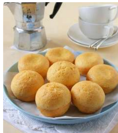
Pan de Queso

Minas Gerais es conocida por producir varios tipos de queso, algunos de los cuales incluso han sido galardonados con premios internacionales.