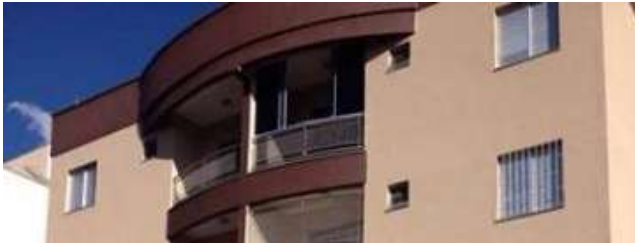
Pisos individuales o estudios

El costo de vida en Uberlândia varía entre R$1000 y R$1300, dependiendo de la elección del estudiante en cuanto a vivienda y opciones de alimentación.