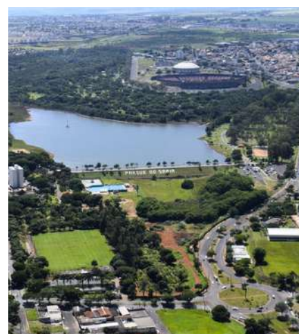
Parque del Sabiá en Uberlândia

Si quieres pasar una tarde al aire libre, el Parque do Sabiá es una excelente opción. El lugar cuenta con pistas para correr, snack-bar, zoológico, acuario, lago y otras atracciones para garantizar una tarde agradable con la naturaleza.