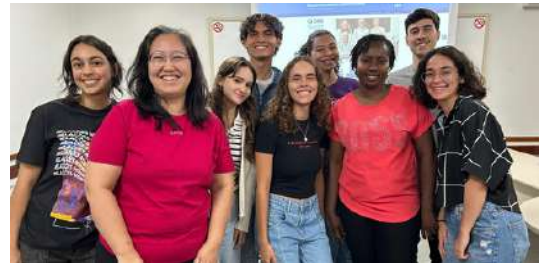
Equipo ProInt 2025

Algunas de las actividades realizadas por el ProInt incluyen la INTERUFU (Semana de la Internacionalización de la UFU), el curso Adolescentes Políglotas y la Recepción de estudiantes internacionales.