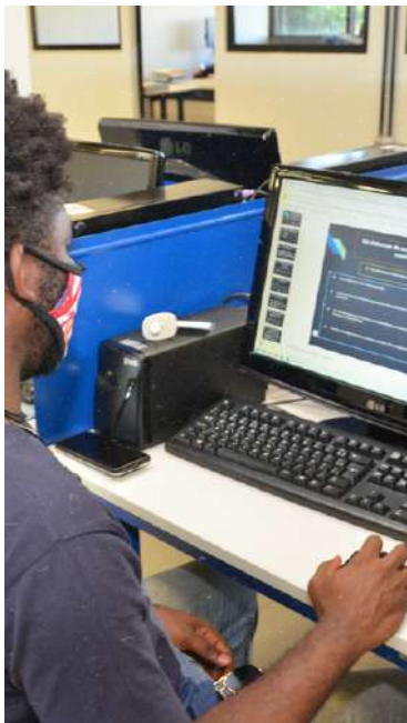
Laboratorio del campi Monte Carmelo