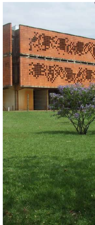
BIBLIOTECA DEL CAMPI UMUARAMA

Más información sobre Sisbi/UFU está disponible en: bibliotecas.ufu.br