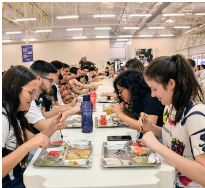
Restaurante Universitário del campi Santa Monica

La ciudad cuenta con numerosos restaurantes, bares y snack-bars. Te recomendamos que pruebes la rica cocina de Minas Gerais y las delicias brasileñas durante tu estancia. Uberlândia también cuenta con una vasta red gastronómica que incluye platos internacionales, como cocina mexicana, japonesa e italiana, entre otros.