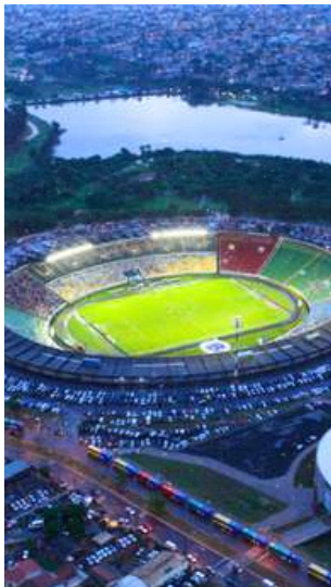
Estadio Parque del Sabiá