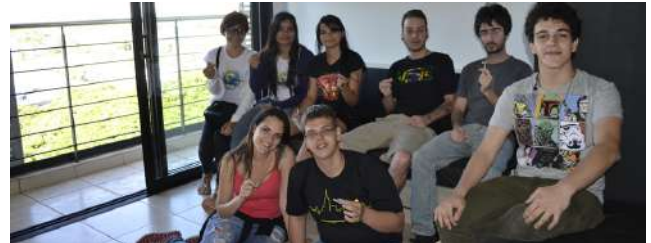
República (residencias compartidas por estudiantes)