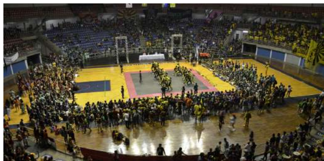
Olimpiadas Universitarias en el Gimnasio Sabiazinho

La UFU cuenta con una excelente infraestructura: canchas deportivas múltiples; gimnasios y centros de fitness; escenarios para presentaciones musicales, teatrales y de danza; un coro; museos de arte, memoria indígena, ciencia, minerales y rocas; y mucho más.