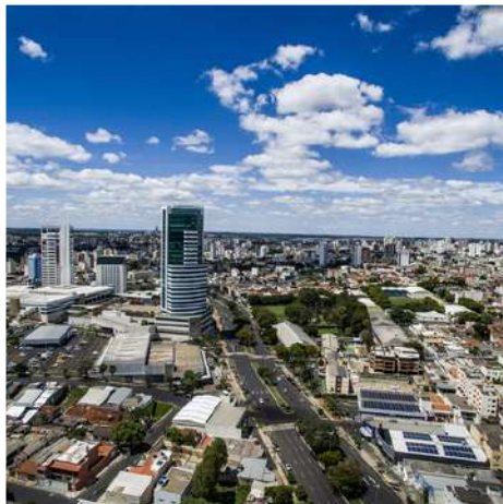
Vista aérea de Uberlândia

Uberlândia se encuentra en el estado de Minas Gerais y es la ciudad más grande del interior de Minas Gerais. Está ubicada en el oeste del estado, en la región del Triângulo Mineiro. Actualmente, es una de las ciudades de más rápido crecimiento en el estado y su economía se basa en la agroindustria. Uberlândia cuenta con un aeropuerto con conexiones diarias a las principales capitales del país, como São Paulo, Río de Janeiro y Belo Horizonte. También cuenta con dos centros comerciales, parques, museos y hermosas cascadas. El clima predominante es tropical y semi-húmedo. Por lo tanto, durante la mayor parte del año, encontrará altas temperaturas.