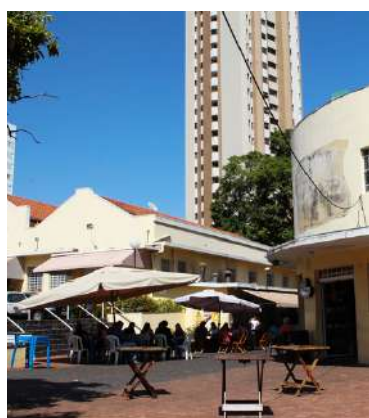
Mercado de Uberlândia

Los campus de la UFU están ubicados en ciudades muy diversas. Uberlândia es la más grande de ellas y tiene varias opciones de entretenimiento. Además de las muchas opciones de fiestas y eventos, recomendamos un recorrido cultural por el Mercado Municipal, ubicado en el centro de la ciudad, donde puedes encontrar tiendas especializadas en artesanías y alimentos típicos.