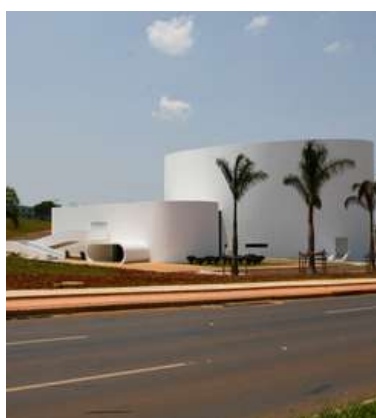
Teatro de Uberlândia

Las otras ciudades, Monte Carmelo, Patos de Minas e Ituiutaba, son más pequeñas, pero ricas en contenido histórico. También cuentan con centros comerciales, parques, museos, cines, teatros y muchas otras atracciones de ocio en las localidades.